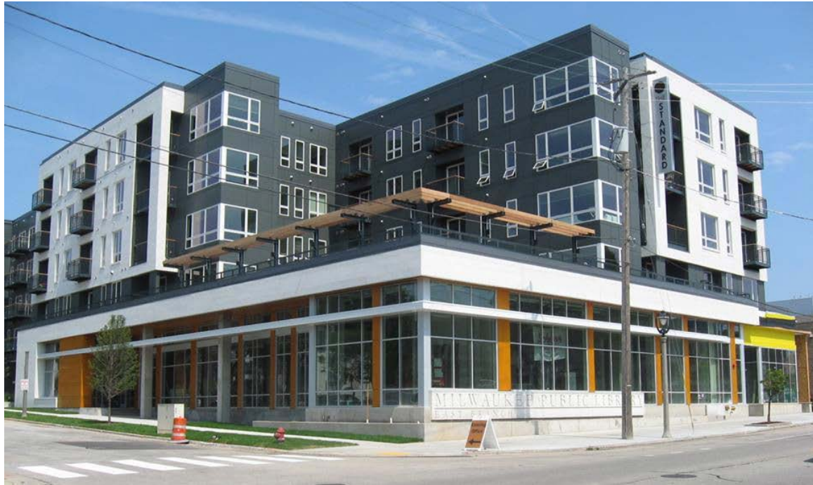
La nueva sucursal East que abrirá en 22 de noviembre 2014