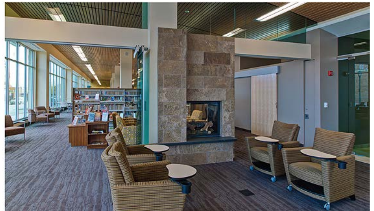
Vista interior de la sucursal Villard Square que abrió en el 2011

Como nuestros otros nuevos proyectos, el edificio nuevo de la biblioteca Forest Home será una parte de una iniciativa para el desarrollo catalítico que mejorará el acceso de los residentes a una biblioteca del siglo 21, rica en tecnología.